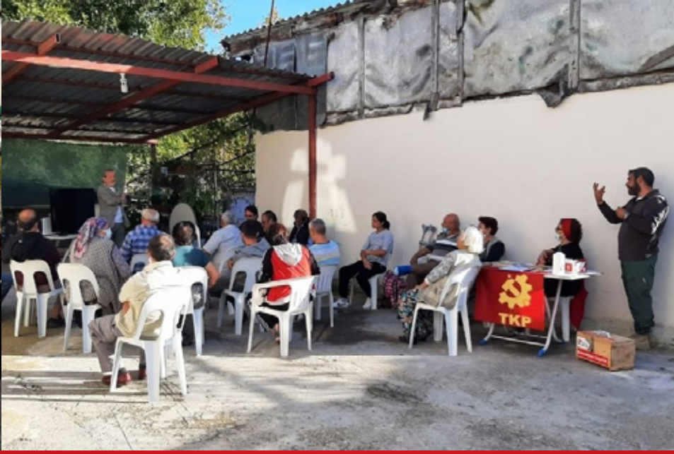
Antalya, Finike, Gökbük Köy Evi