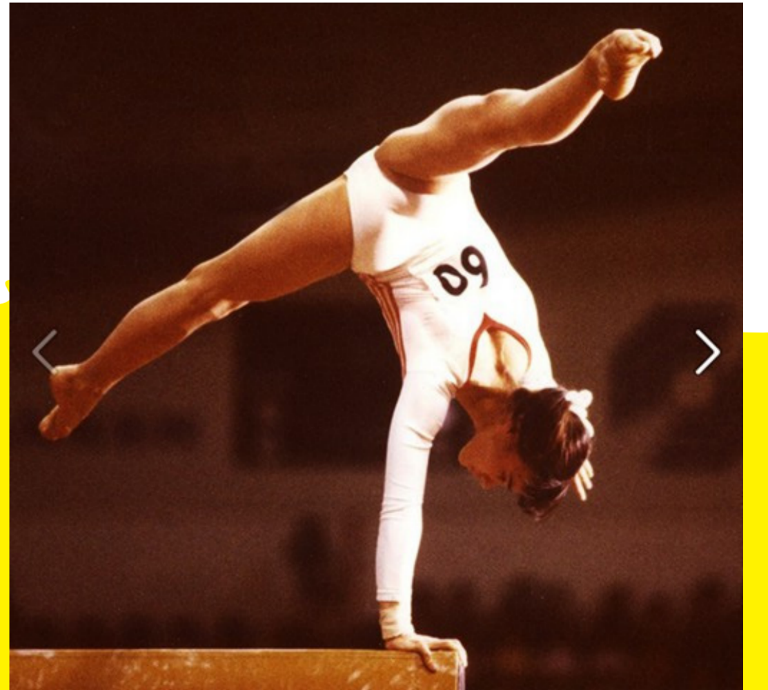
Artistik jimnastikte iki kez Olimpiyat şampiyonu olan Natalia Shaposhnikova

“Bu yüzden önemi oldukça büyük olan bu spor anlayışı, yeni spor insanlarının önünü açtı. Bunda en önemli paylardan birisi ise kadınlardaydı. Her alanda bir özne olabilmeyi başaran kadınlar, sporun da en önemli bileşenleri durumuna yükseldiler. Önemli kadın sporcular, spor bilimciler yetişti.”