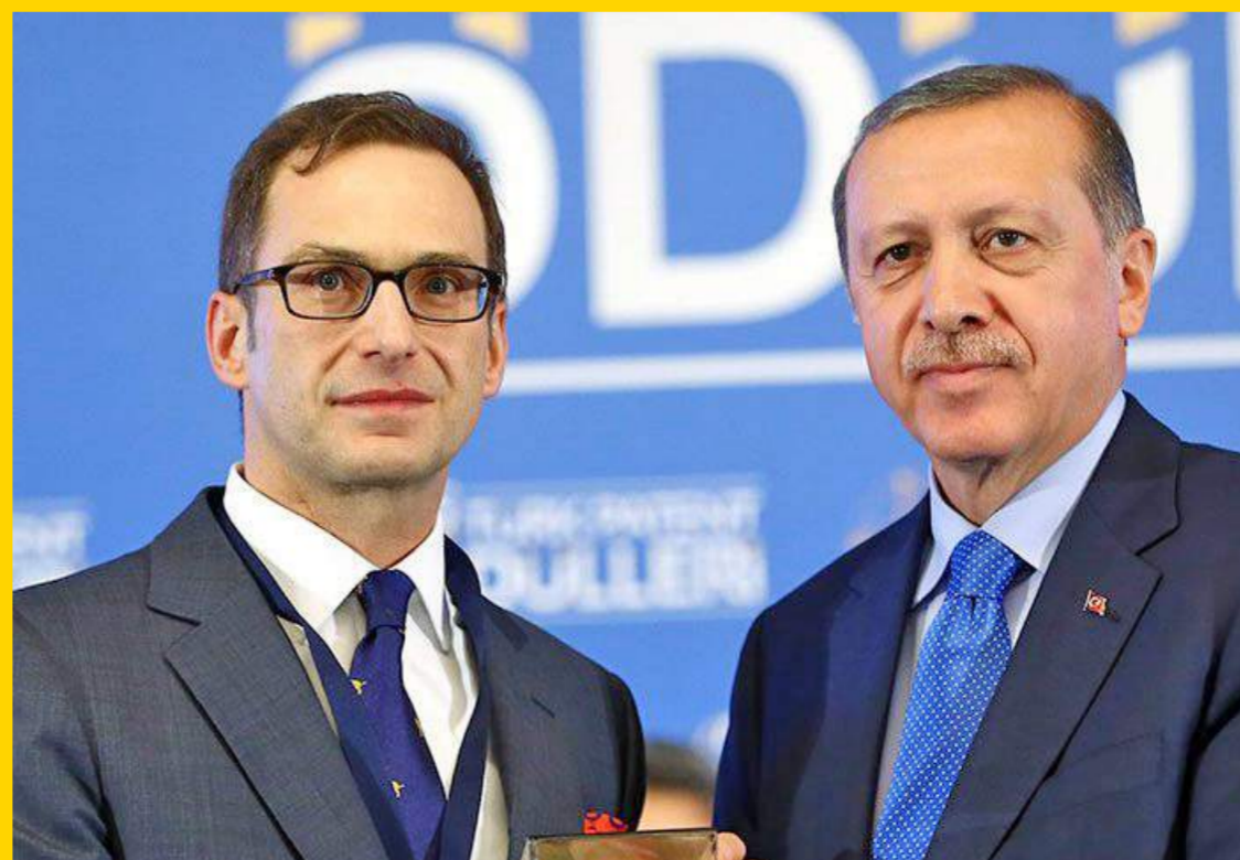
Koç Holding Yönetim Kurulu Başkanı Ömer Koç