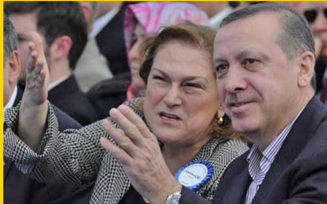
Sabancı Holding'in yönetim kurulu başkanı Güler Sabancı