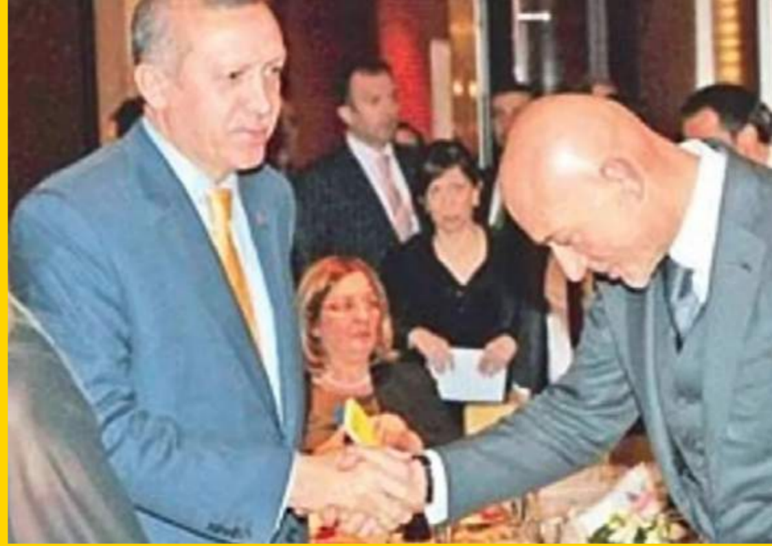
Doğuş Holding'in ve Garanti Bankası'nın yönetim kurulu başkanı Ferit Şahenk.

Her patron kendi girişimcilik hikayesini anlatmayı pek sever. Hiç üşenmez her yıl üniversitelerdeki kariyer günlerine gider anlatır, gazetelerin pazar eklerine anlatır, yetmez yaşlanınca otobiyografi yazar anlatır. Peki ne anlatır? İşçilerin emeğini nasıl sömürdüğünü, TÜPRAŞ'taki iş cinayetlerini, Carrefoursa'daki karşılıksız gece mesailerini anlatmaz da... Ne kadar "akıllı" olduğunu, çalışkanlığını, inatçılığını anlatır. Sabancılar tehcir sonrası 1920'li yıllarda Adana'da Ermenilerden kalan çırçır fabrikalarına, Koçlarsa 1942'de çıkarılan Varlık Vergisi sayesinde Yahudi sermayesine nasıl konduklarını anlatmaz da; girişimci ruhla yoktan var ettiklerini anlatır. AKP iktidarı döneminde, TÜPRAŞ'ı nasıl yuttuklarını, kaç milyon vergilerini sildirdiklerini, bedavaya kapatıkları enerji dağıtım şirketlerini anlatmazlar ama bol bol masal anlatırlar. Külahımıza anlatsınlar! Yıllarca bu "girişimcilik" hikayelerini dinleyen AKP'nin yeni yetmeleri de şimdi abilerinin, ablalarının yolundan yürüyor.