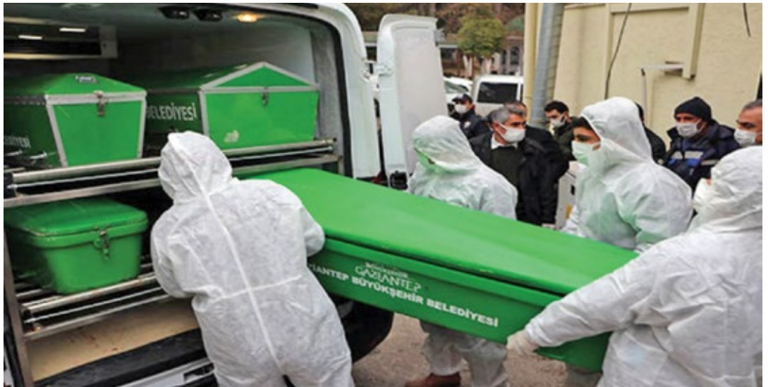
Sani Konukoğlu Uygulama ve Araştırma Hastanesi Covid-19 yoğun bakım servisinde çıkan yangında 12 kişi yaşamını yitirdi.

Sağlık Bakanlığı Kamu Hastaneleri Genel Müdürlüğü tarafından Gaziantep'te