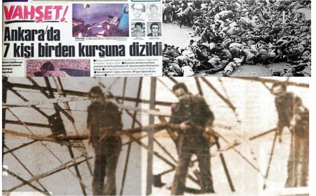
1977’de 34 kişinin yaşamını yitirdiği 1 Mayıs’ta kalabalığa Taksim Sular İdaresi üzerinden ateş açan failler hâlâ ortaya çıkarılmadı.

Bu kirli yükselişin tarihine bakacak olursak, aslında antikomünizmin tarihini de görmüş oluyoruz. Sınıf mücadelelerinin yükseldiği, işçi sınıfının güçlendiği her durumda patronun tetikçiliği görevini yerine getiren çetelerin Türkiye sınırları içindeki tarihine bir göz atmak bile, bugün neden