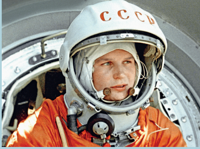
Uzaya çıkan ilk kadın kozmonot Valentina Tershkova

Madde 75- Çocukların bakımı, beslenmesi, sağlıklı bireyler olarak gelişimi ve eğitimi, devletin güvencesi altındadır.