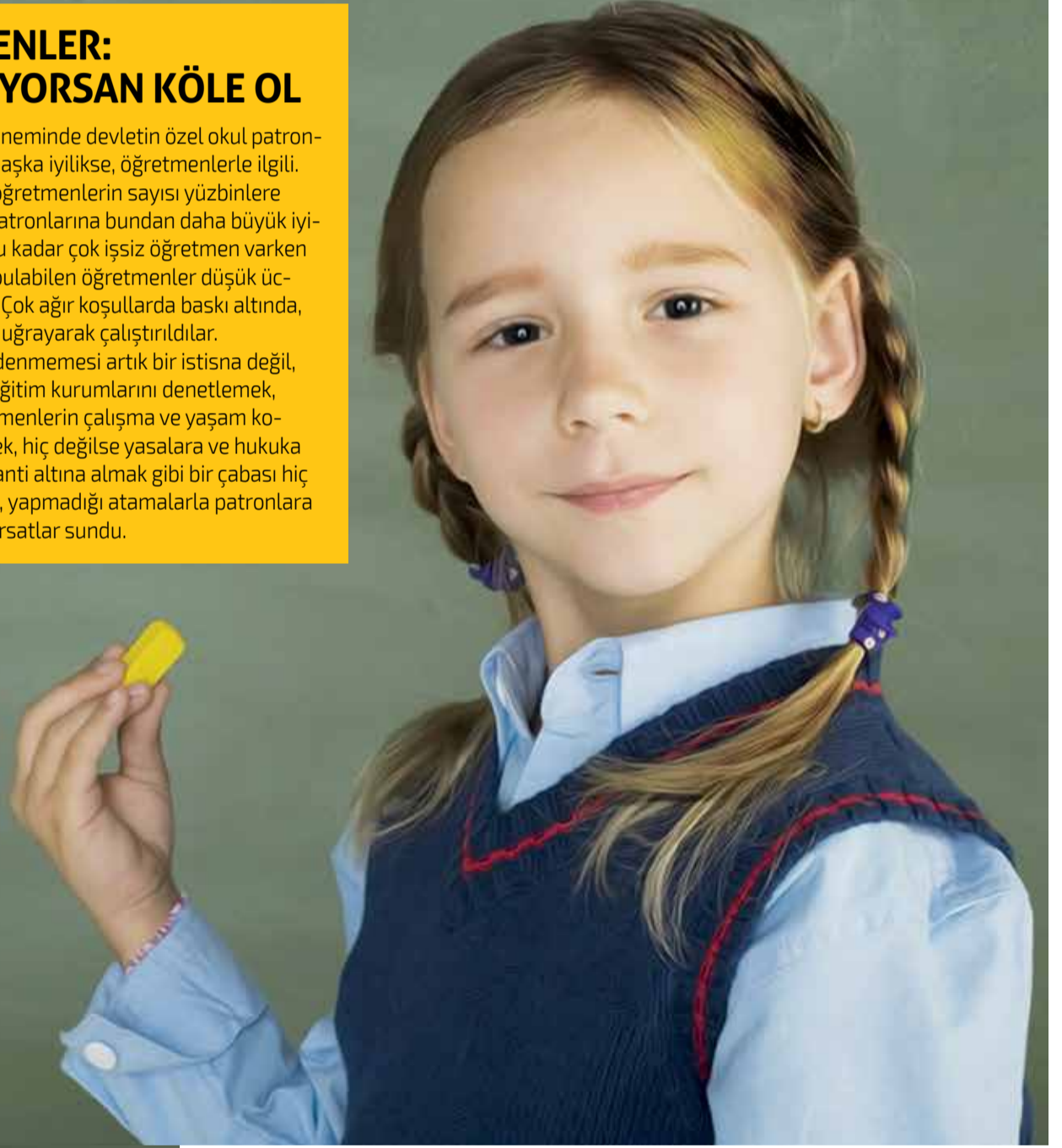
SAMANALTI / Sait Munzur

Özelleştirmeci sermaye kafasından, eğitimi kurtaracak yegane yolu eğitimi piyasadan kurtarma planını seçmesini bekleyemeyiz zaten.