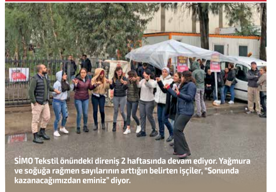
SİMO Tekstil önündeki direniş 2 haftasında devam ediyor. Yağmura ve soğuğa rağmen sayılarının arttığını belirten işçiler, "Sonunda kazanacağımızdan eminiz" diyor.