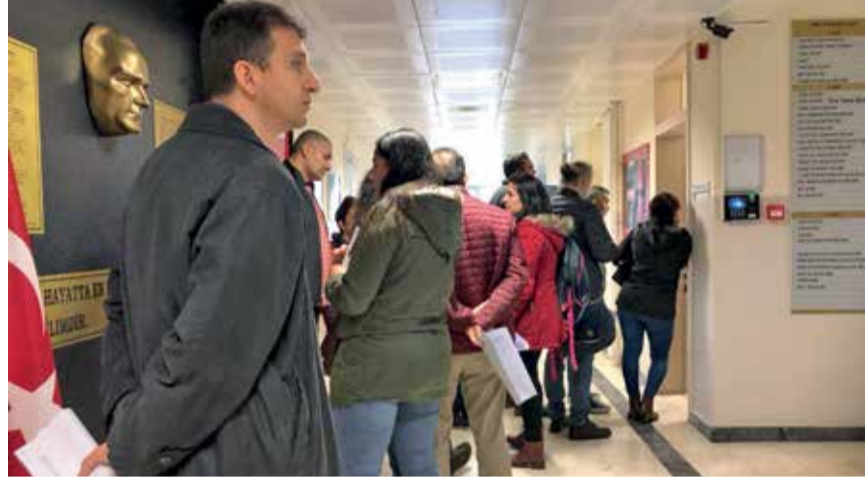
Kapanan Özgür Boza Okulları velileri, PE avukatı ile birlikte sorunlarını iletmek ve haklarına sahip çıkmak üzere Ataşehir İlçe Millî Eğitim Müdürlüğü'nde...

PE'ye ulaşan şikayetler arasında en büyük paya eğitim alanında yaşanan hak gasplarının sahip olduğunu ve en fazla örgütlenme arayışının özel okullarda ortaya çıktığını söyleyen Savaş,