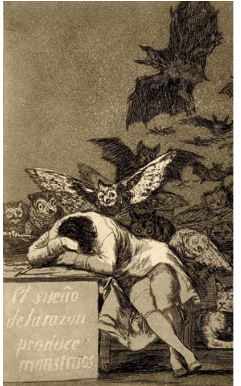
➔ Francisco Goya'nın 1799 yılında yaptığı El sueño de la razón produce monstruos (Aklın uykusu canavarlar doğurur) isimli gravür.

Eğer bıçak kemiğe dayanamayı, insan inanç konforunu bırakır, sormaya, kölelikten kurtulmaya çabalar mıydı, tartışılır. Ancak ilk insandan bu yana inanç insanın içindedir, zorunlu, genlere yazılı bir duygu/dürtü demek pek akılcı olmayacaktır. Şunu söylemek mümkün; eğer bir işlevi olmasa, bir ihtiyaca denk düşmese, insan tanrıyı ve devamında dinleri yaratmak zorunda kalmazdı. Ardından da bu yaratısının tutsaklığından kurtulmak için bunca zaman çırpınmazdı. ■