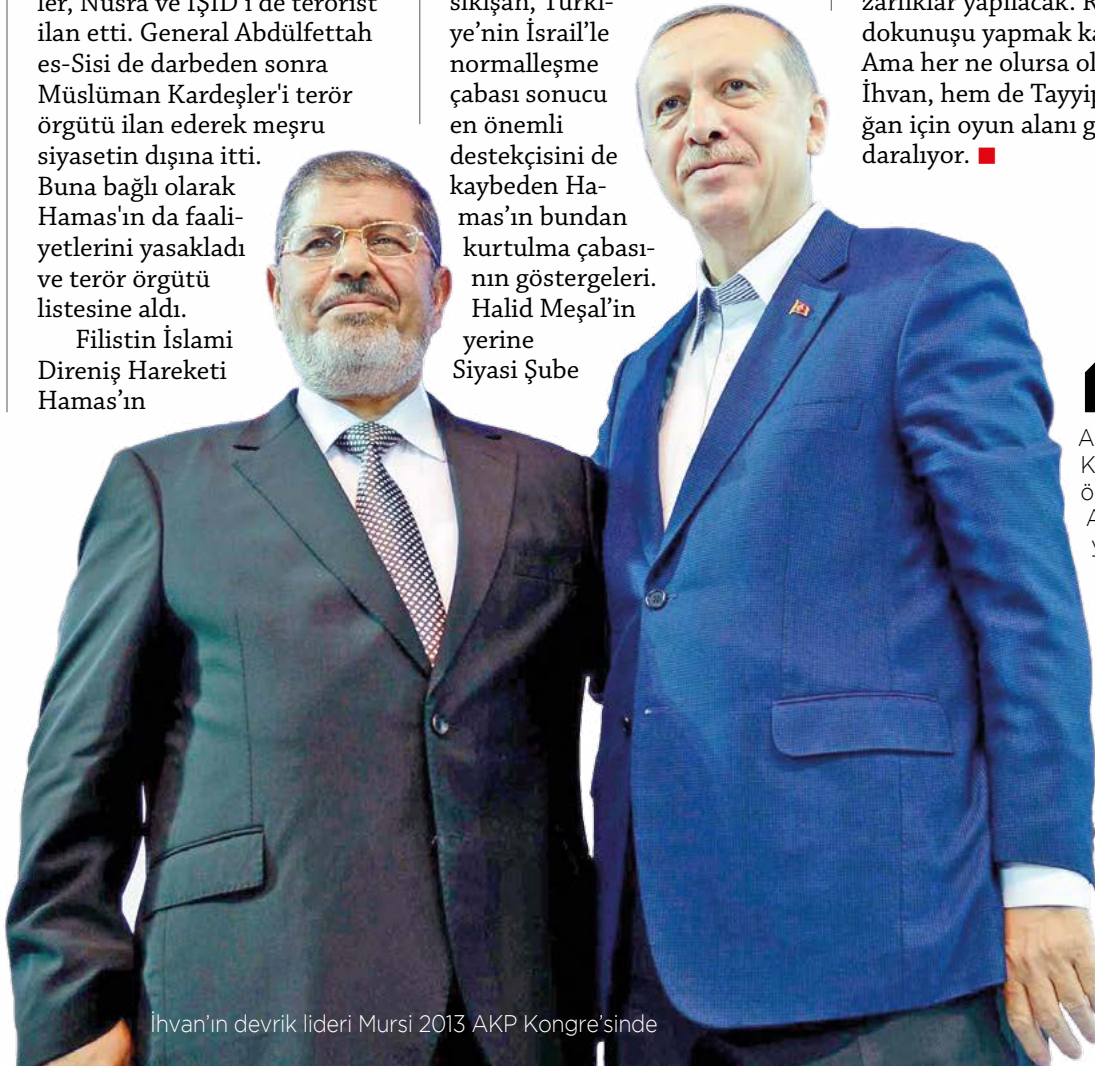
İhvan'ın devrik lideri Mursi 2013 AKP Kongre'sinde

Sarayın adamları alelacele ABD'nin yolunu tuttu. Yandaş basının karartma çabaları boşuna. Suriye'de işler hiç iyi gitmiyor. "Çatışmasızlık bölgeleri" ABD ve Rusya'nın mutabakatıyla oluşturuldu. Türkiye bu denklemin dışında ama PYD tam tersine bölgede giderek daha fazla güçleniyor. Belli ki Tayyip Erdoğan gidene kadar zemin hazırlanacak, pazarlıklar yapılacak. Reis'e son dokunuşu yapmak kalacak. Ama her ne olursa olsun hem İhvan, hem de Tayyip Erdoğan için oyun alanı giderek daralıyor. ■