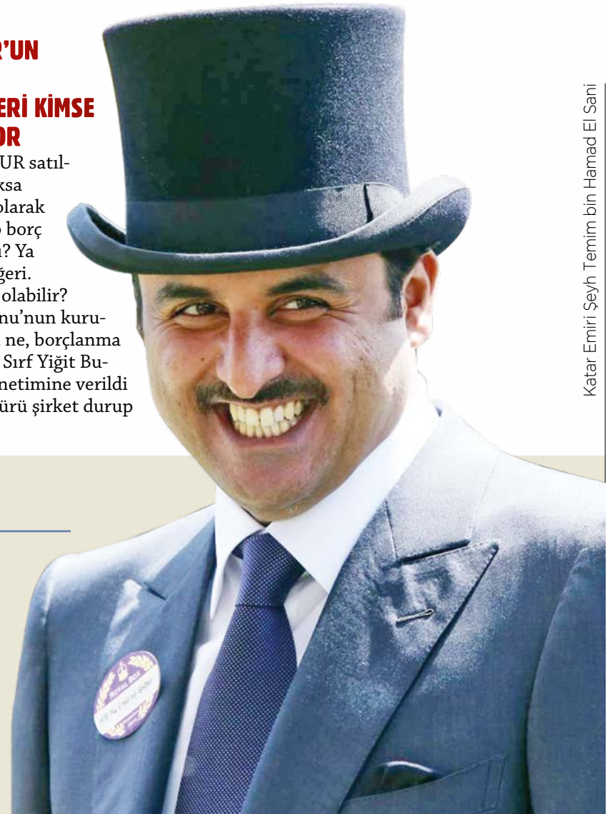
Katar Emiri Şeyh Temim bin Hamad El Sani

Belli ki Katarlılarda para çok, AKP'nin iktidarda tutunmak için o paraya ihtiyacı var. Şu soru ise bütün bunlardan daha korkunç bir şüpheyi ifade ediyor: Ülkeyi topyekûn satsalar "Rize" yine alkışlar mı? ■