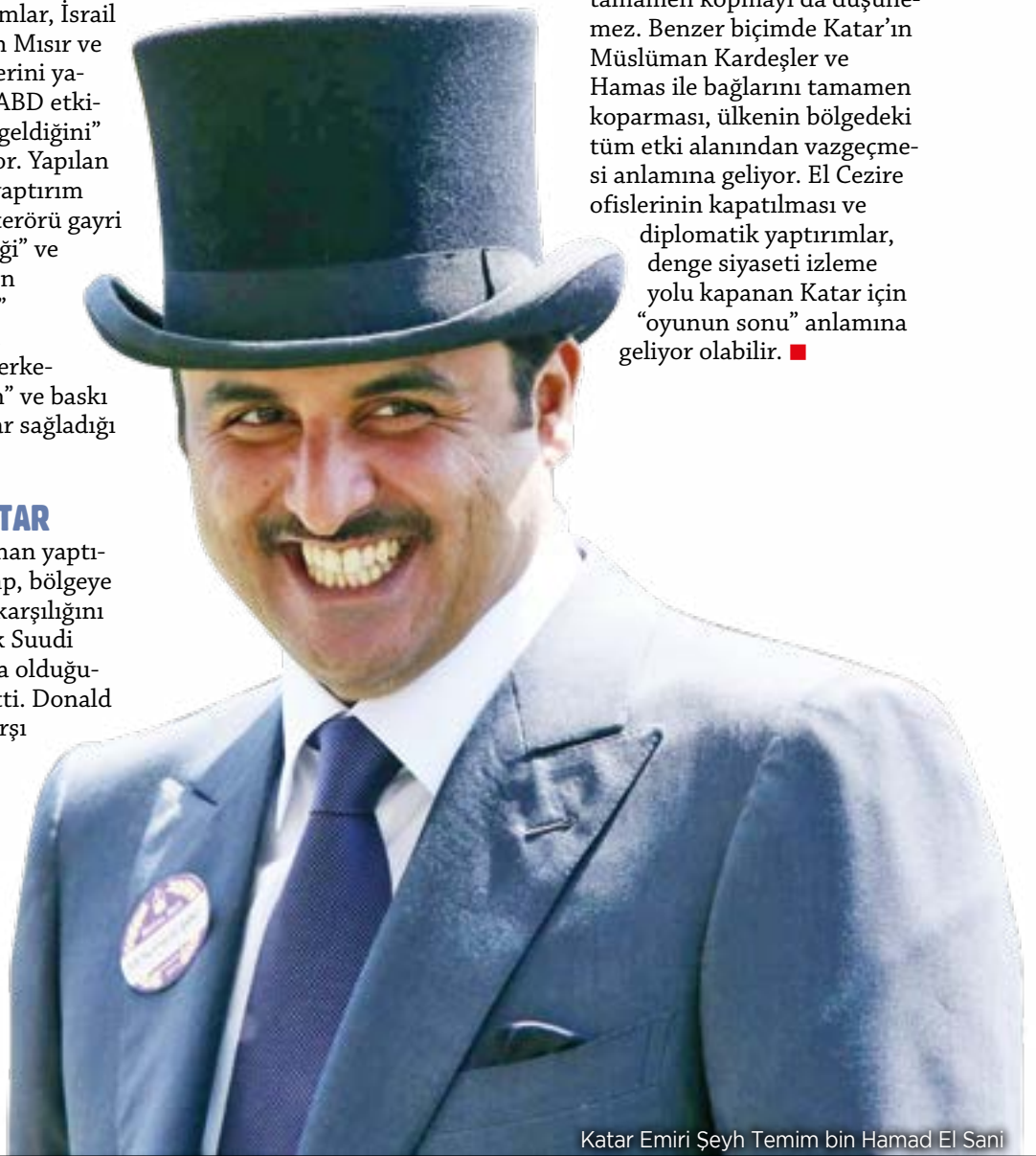
Katar Emiri Şeyh Temim bin Hamad El Sani

Katar'ın kolay bir çıkış yolu olmadığıysa açık. Kendisini İran eksenine yerleştirmesi coğrafi, ekonomik ve diplomatik sebeplerle mümkün olmayan Katar, İran'dan tamamen kopmayı da düşünmez. Benzer biçimde Katar'ın Müslüman Kardeşler ve Hamas ile bağlarını tamamen koparması, ülkenin bölgedeki tüm etki alanından vazgeçmesi anlamına geliyor. El Cezire ofislerinin kapatılması ve diplomatik yaptırımlar, denge siyaseti izleme yolu kapanan Katar için "oyunun sonu" anlamına geliyor olabilir. ■