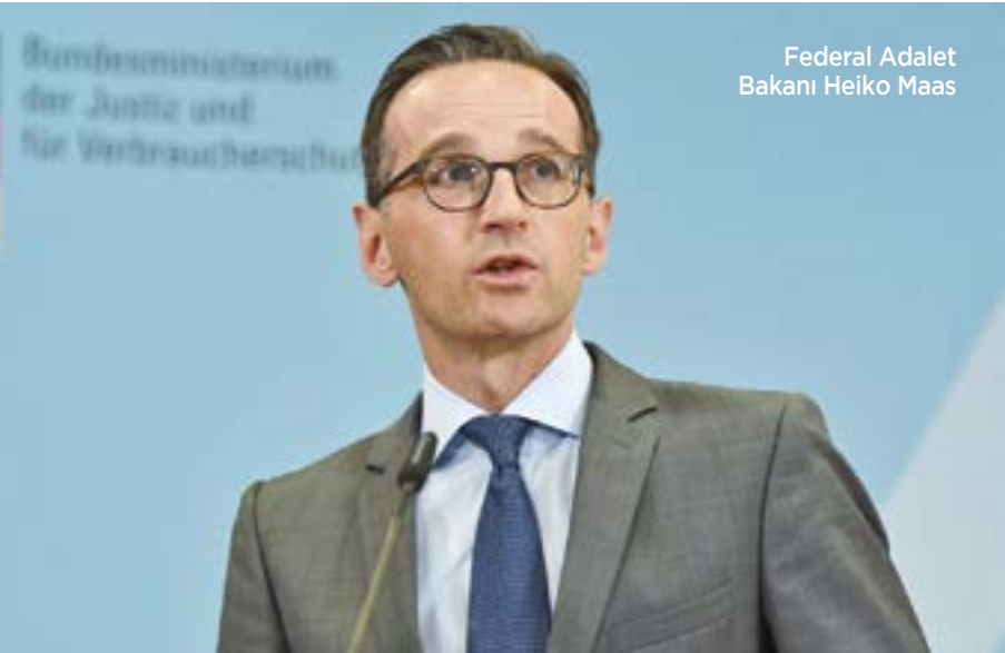
Federal Adalet Bakanı Heiko Maas