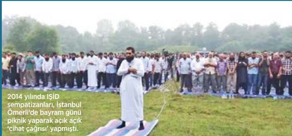
2014 yılında İŞİD sempatanları, İstanbul Ömerli'de bayram günü piknik yaparak açık açık 'cihat çağrısı' yapmıştı.

rattığı korku, ülkede yarattığından daha fazla. Ülkenin yarısına savaş açmış halleri bundan. Vücut dilleriyle söyledikleri şu: Onlar kazanırsa Türkiye kaybedecek, Türkiye kazanırsa onlar. AKP ve reisi tuhaf, çözümsüz bir problemin tam ortasında özetle. Haliyle bu ikilinin odaklandığı tek şey şartları kendi lehine çevirmek. Haliyle bu iktidar bileşeni kendi pozisyonunu sağlama almak için kendi taraftarları dahil bütün ülkeyi yakmaya, iç savaşın, savaşın içine itmeye hazır oldukları mesajı vermekten çekinmiyor. Eski İslamcı yeni liberal Levent Gültekin bir söyleşisinde bu ruh halini şöyle anlatmıştı: "Adımı vermeyeyim, çok▶