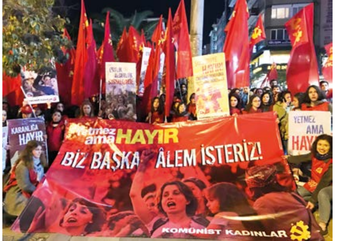
8 Mart gecesi Dünya Emekçi Kadınlar Günü için biraraya gelen komünist kadınlar böyle söyledi: Yetmez ama Hayır! Biz başka alem isteriz...

BİR MUTFAK ROBOTLARI KALMIŞ SIZMADIKLARI