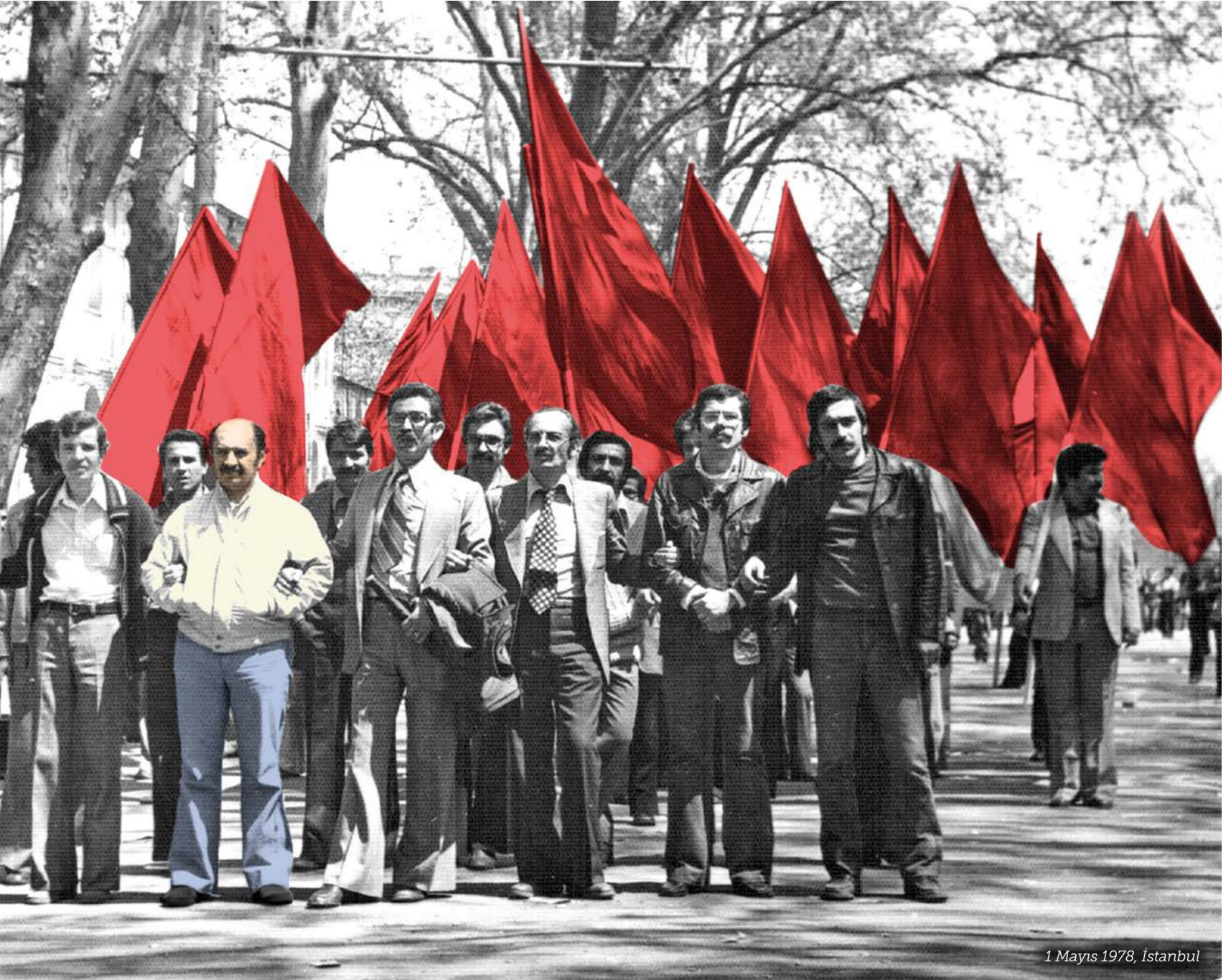
1 Mayıs 1978, İstanbul

iflas ederek, makinelere bağlı acı çekerek tükendi”.