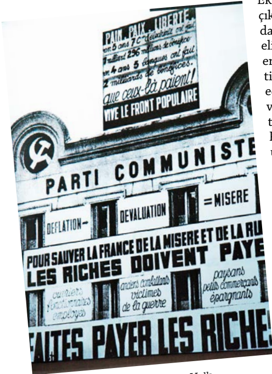
Ekmek, barış, özgürlük! Yaşasın Halk Cephesi!(1936, FKP Merkez Komite binası.)

Fransız Komünist Partisi iki dünya savaşı arasında faşizme karşı direniş içerisinde önemli bir yer tuttu. Bu dönem, aynı