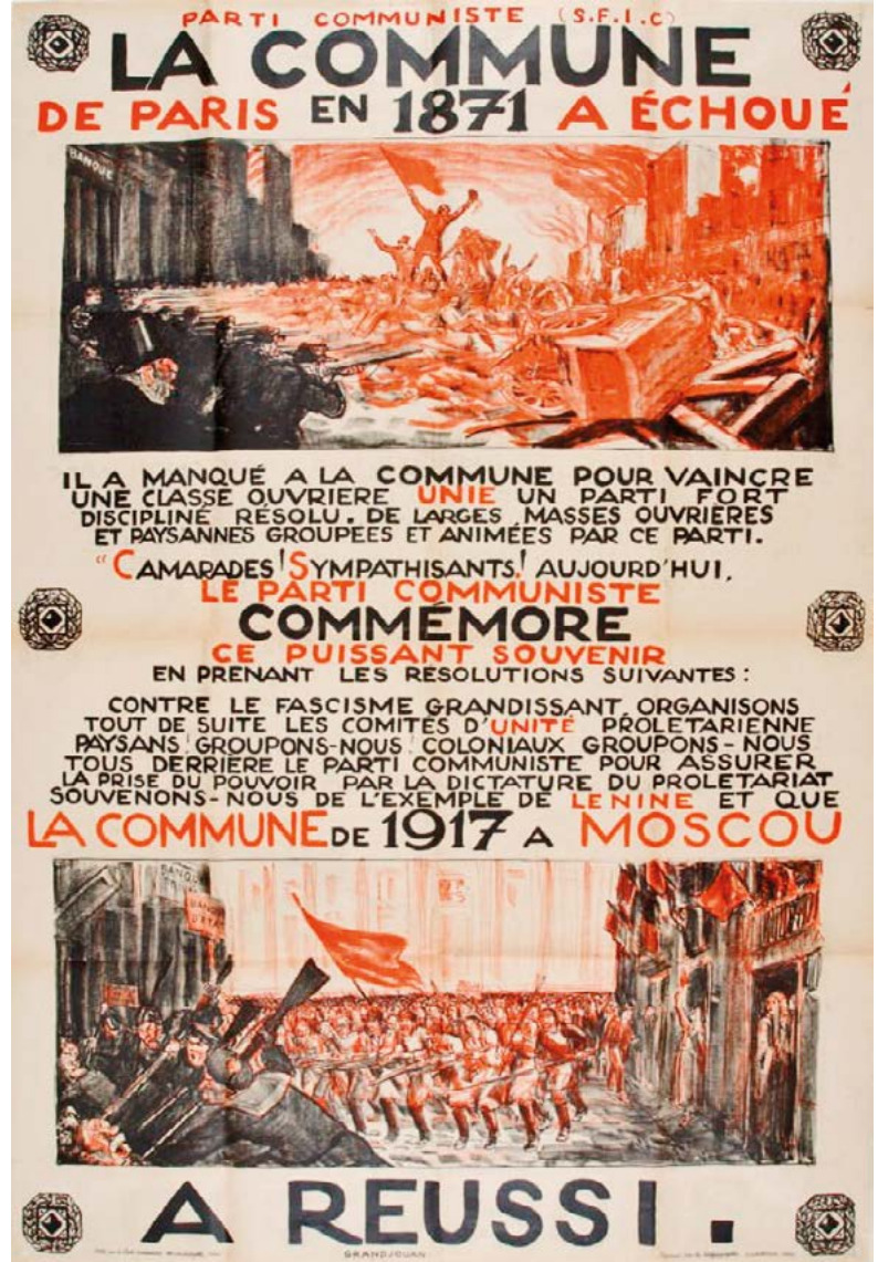
1871'deki Paris Komünü başarısız oldu, Lenin'in Moskova'daki 1917 Komünü başarılı. Komünist Parti(SFIC)'nin bir afişi.

Sosyalist Parti'nin bir birliği olan Uluslararası İşçi Örgütü'nün Fransız seksiyonu (SFIO) 20 Aralık 1920 tarihinde birlikten ayrılıp Komünist Enternasyonal'e katılma kararı aldı. Bu ayrılığın en önemli politik tartışması ise, birliğin Büyük Savaş sırasında 'Alman tehdidine' karşı ulu-