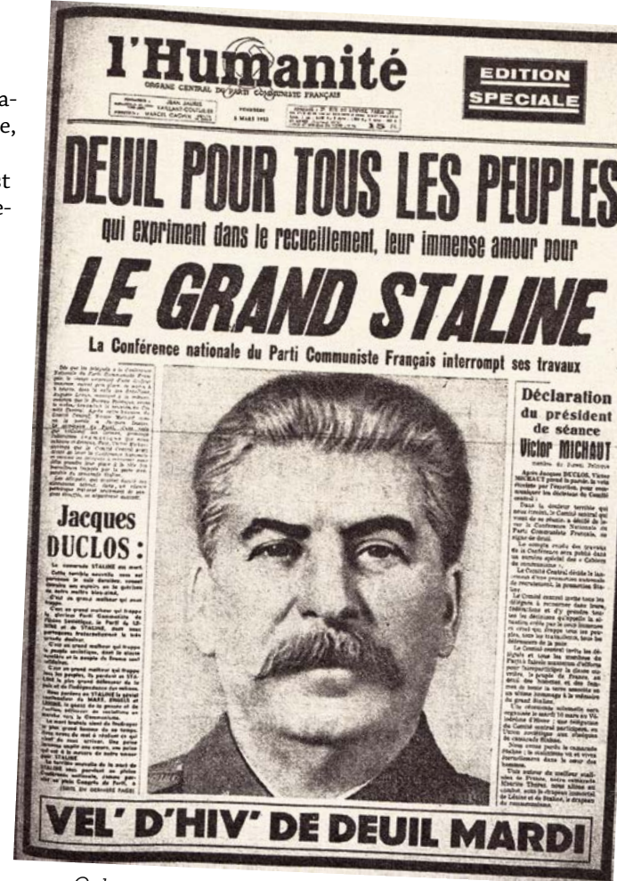
Onların sonsuz sevgisinde ve akıllarında yer eden Yüce Stalin için bütün halklar yasta. (FKP'nin merkezi yayın organı L'Humanité'nin özel sayısı-5 Mart 1953)

2017 yılı tarihin tekerleğinin epey hızlı döneceği bir yıl olacaktı gibi görünüyordu. Fransa siyaseti için de durum böyle. Fransa yavaş yavaş seçim atmosferine girmeye başladı.