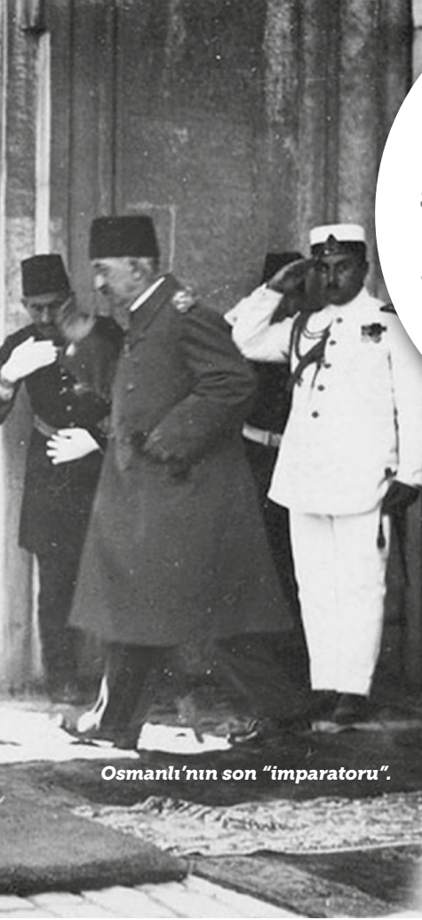
Osmanlı'nın son "imparatoru".

İŞÇİ SINIFI KURTULUŞ MÜCADELESİNDE YÜZÜNÜ GERİ OLANA DÖNEREK, TARİHSEL İLERLEMİYİ YOK SAYARAK ASLA YOL ALAMAZ. VE AYNI İŞÇİ SINIFI, İNSANLIĞIN KAZANIMLARINI KAPİTALİZMİ DEVİRME SORUMLULUK VE İRDESİNİ GÖSTERMEDEN TAŞIYAMAZ.