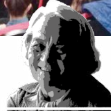
BEHİCE BORAN KADIN ATÖLYESİ

yana tavrı alan bu oluşumlar, mücadele etmek isteyen insanların enerjisininin soğurulmasında da görev üstleniyorlar.