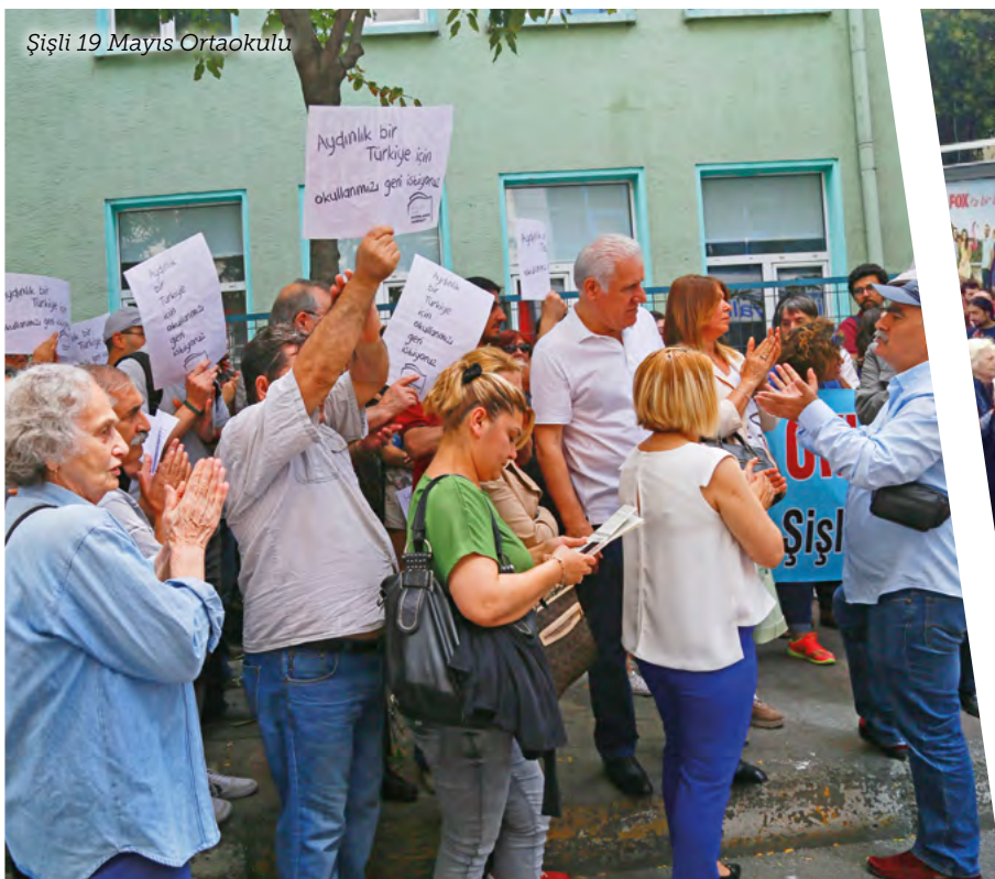
Şişli 19 Mayıs Ortaokulu

İSTANBUL'UN ÜÇ AYRI MERKEZİNDE İMAM HATİPLEŞTİRİLEN ÜÇ OKULDA SÜRDÜRÜLEN MÜCADELE, BU OKULLARIN ÖNÜNDE YAPILAN KİTLESEL BASIN AÇIKLAMALARIYLA DEVAM ETTİ.