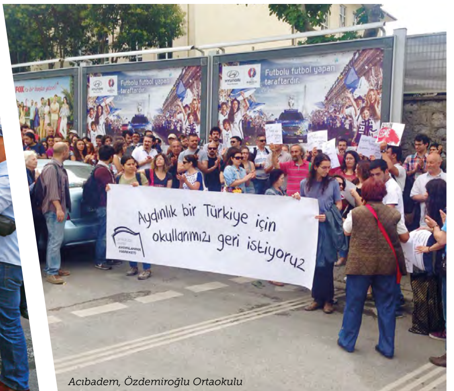
Acıbadem, Özdemiroğlu Ortaokulu