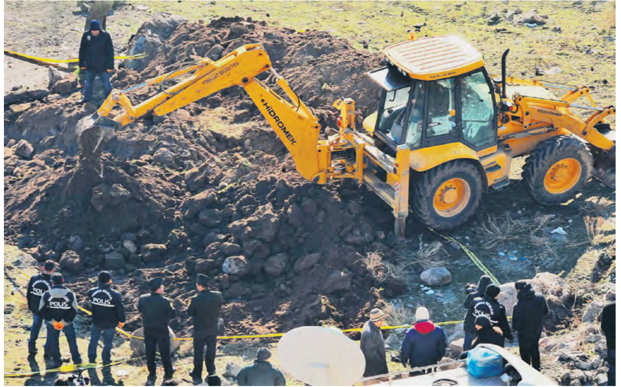
Ergenekon operasyonu sırasında akılda kalan görüntülerden biri de soruşturmada ele geçirilen krokilerde bulunduğu öne sürülen ve içerisinde patlayıcı maddelerin de bulunduğu cephanelerin dozerlerle kazılarak çıkarılmasıydı. Dozerle!

Danıştay saldırısı, Cumhuriyet gazetesinin bomba ve molotof saldırısı davaları ile 1, 2, 3 olarak süren Ergenekon davalarının birleşmesi sonucu ortaya çıkan 274 sanıklı devasa yargılama bu yıl karara bağlandı. 20 Ekim 2008'de başlayan ilk duruşmadan bu yana, neredeyse tüm duruşmalar boyunca delillerin sahte olduğu, suçlamaların gerçek olmadığı sanıkların, avukatların defaatle savunmalarında yer almasına rağmen 5 Ağustos tarihinde mahkeme, çoktan çökmüş iddianame üzerinden ceza yağdırdı. Dava sanıkları eski Genelkurmay Başkanı İlker Başbuğ, emekli orgeneral-ler Hürşit Tolon, Şener Eruygur, Nusret Taşdelen, Eski 1. Ordu Komutanı Hasan İğsız, emekli Korgeneral Mehmet Eröz ve Sevgi Erenerol'a müebbet; İşçi Partisi Genel Başkanı Doğu Perinçek, emekli Al-