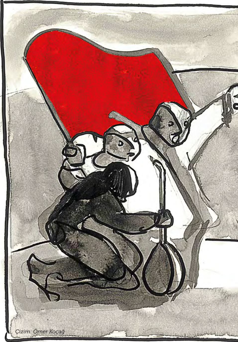
Çizim: Ömer Koçağ

Şimdi söylemenin tam zamanı... Büyük Ekim Sosyalist Devrimi 1917'de zafere ulaştıysa bunda Rusya'da 19. yüzyılın sonlarından itibaren genç işçi ve öğrenciler arasında muhafazakâr düşüncelerin gerilemesinin, bağınazlığın kırılmasının, özetle ideolojik iklim değişikliğinin büyük payı vardı. Tarihçiler