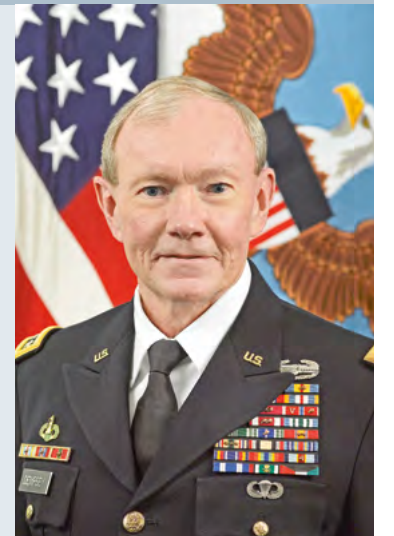
ABD Genelkurmay Başkanı Dempsey

Ancak daha dikkat çekici olan, ABD'li yetkililerin, Rusya'nın ABD'nin müttefikleri ile özellikle de Kürtlerle yeni bir ittifak kurabileceğinden endişe etmeleri. Yetkililer Kürtlerle Rusya arasında doğrudan bir bağlantı olmadığını söylese de, Kürtlerin Halep'teki ilerleyişinin Rus hava saldırıları ile bağlantılı olması ve Kürt-Rus ittifakının kurulması ABD'nin çekindiği başlıklardan bir tanesi. ABD'li yetkililer, Rakka'da da benzer bir durum olduğunu, Rus hava saldırılarına QSD'nin ilerleyişinin eşlik ettiğini söyledi.